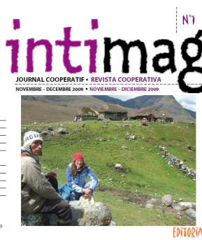
Journal d'échanges interculturels

Ce journal est un projet éducatif d'échanges interculturels entre enfants de France et du Pérou. Esto revista es un proyecto educativo de intercambio cultural entre niños de Francia y del Perú.