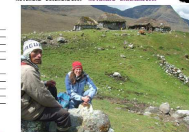
Journal d'échanges interculturels

Ce journal est un projet éducatif d'échanges interculturels entre enfants de France et du Pérou. Esto revista es un proyecto educativo de intercambio cultural entre niños de Francia y del Perú.