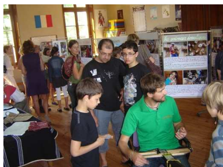
Exposition « Picardie- Pérou : Sommes nous si différents? »