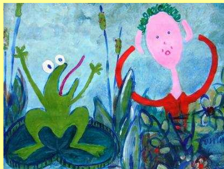
Conte « Papaye et la grenouille qui n'aimait pas l'eau »