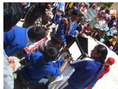
Célébration de la Journée de l'enfant