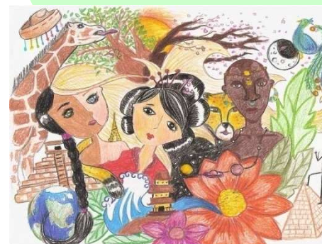
Dessin lauréat du concours 2008