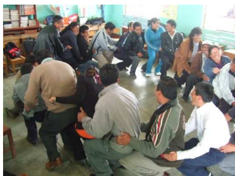
Formation à la coopération