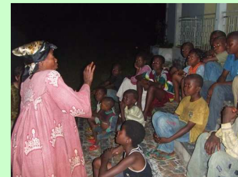
Veillée de contes traditionnels