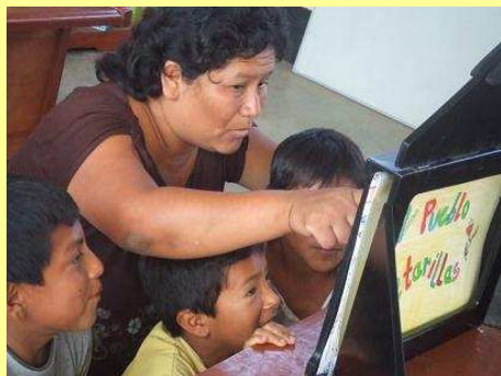
Atelier Kamishibai Animation à la lecture

Entre la France, l'Afrique et l'Amérique du Sud