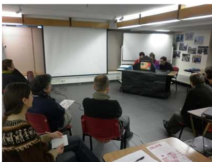
Nous mettons l'accent sur l'intérêt de promouvoir la lecture en groupe.

Nous avons construit ensemble une formation de deux jours sur l'utilisation « active » du Kamishibai, mais en ajoutant un travail de réflexion autour du recueil de la parole.