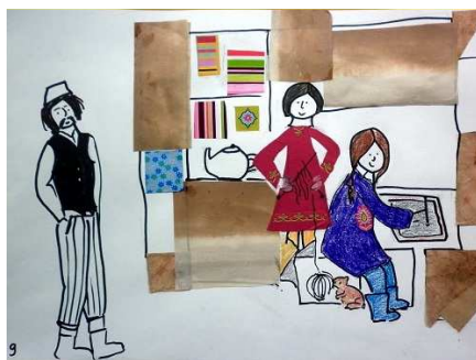
Un coin pour Khava, une histoire originale réalisée par les stagiaires.