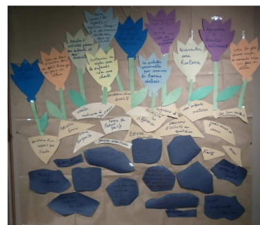
Réalisation des « Fleurs de la parole », un gros travail de réflexion !