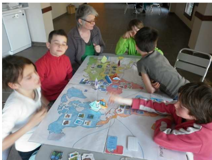
La planète solidaire, un jeu GreenBees.