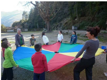
Le parachute a été notre moyen de transport

Pendant les vacances, un groupe d'une dizaine de jeunes se sont donc retrouvés dans le but de découvrir des jeux un peu différents de ce qu'ils pratiquent habituellement : les jeux coopératifs, orientés autour d'une quête menée tout au long de la journée.