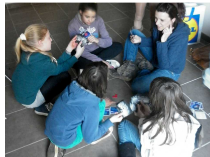
Hanabi : réussir ensemble le plus beau feu d'artifice

► Retrouvez le compte-rendu de ces vacances sur : http://www.greenbees.fr/spip.php?article145