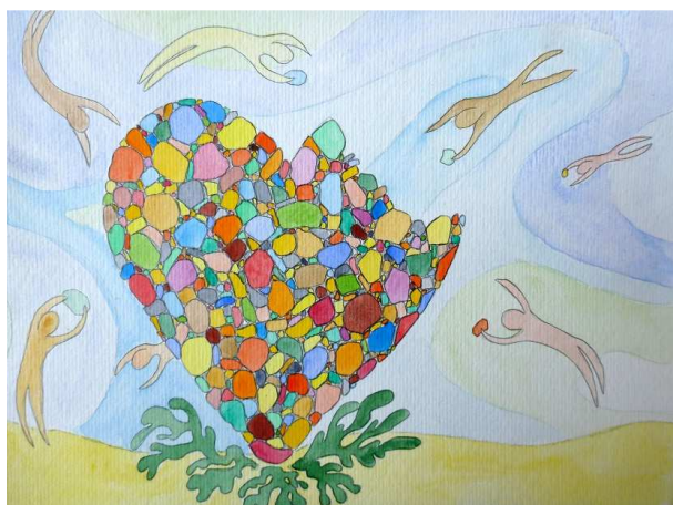
« Unis, osons, sous la mer, Couleurs au gré des courants, Rebâtir le monde » (Concours 2014)

Chaque année, le concours de dessin GreenBees est l'occasion, pour chaque participant, de réfléchir sur cette question du vivre ensemble avec nos différences. Nous vous en proposons deux belles illustrations, qui valent mieux que de longs discours.