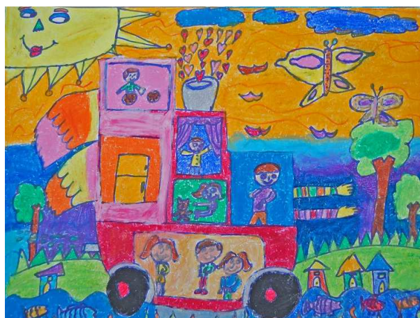
« Je vous invite » (Concours 2012)

Pays participants : Algérie, Espagne, France, Hongrie, Inde, Pérou, Pologne, Philippines, Roumanie.