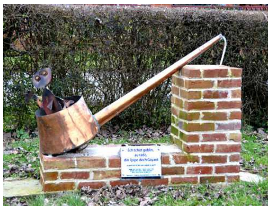
Pipe du Géant à Contay