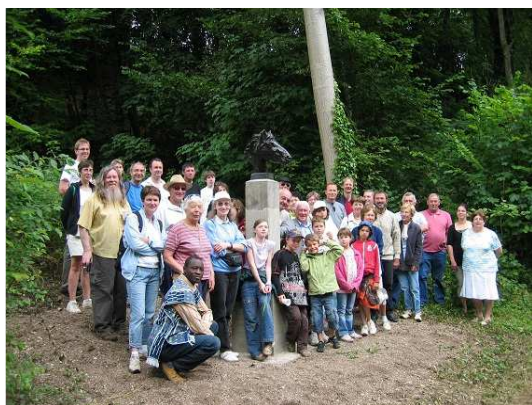
Totem du cheval des puits tournants de Fréchencourt

La bourse accordée par GreenBees permettra d'acheter du matériel et de payer des plaques avec des explications gravées en picard et en français.