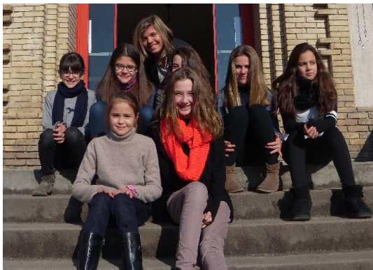
Cette rencontre de l'autre par la correspondance a été proposée à des collégiens de l'Établissement Saint Joseph de Tivoli...

Au cours de l'année 2015, l'association Promesse Solidaire accompagne des enfants bordelais et des enfants paraguayens dans la découverte de l'autre.