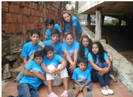
...et des enfants de Bañado Norte de la ville d'Asunción.

Par le biais d'un blog, conçu comme un espace propre et commun d'expression et de partage, les enfants échangeront sur leur vie quotidienne et partageront leurs créations artistiques. A la fin de cette année, un « temps fort », sous la forme d'un camp d'été, sera proposé aux enfants bordelais. Il sera vécu simultanément par les enfants du Paraguay.